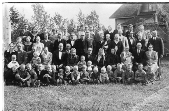
Ensimmäinen sukukokous pidettiin juhannuksena 1931.